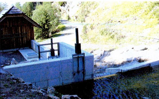
Saubere Energie aus den Niederen Tauern.

INTENTIONEN GAB ES SCHON SEIT LANGEM, DIESES KRAFTWERK ZU ERRICHTEN. DOCH ERST JETZT IST ES SO WEIT. DAS ÖKO-KRAFTWERK DORFERALM WIRD AM 5. SEPTEMBER VORGESTELLT.